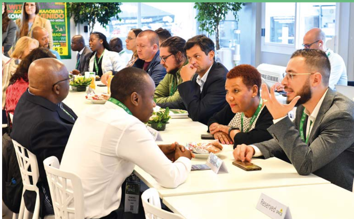
La délégation de "Top acheteurs" représente une dizaine de pays et des entreprises de différentes filières qui viennent chercher sur le SPACE des fournisseurs pour concrétiser des projets d'investissements. / The "Top Buyers" delegation represents a dozen countries and businesses from different domains that are coming to SPACE looking for investment projects.

Also for your convenience, a car-pooling forum is available on space.fr . Thanks to this, you're only a few clicks away from finding a car-pool that's great for you and meeting other visitors. Those services are free and will not ask for a subscription.