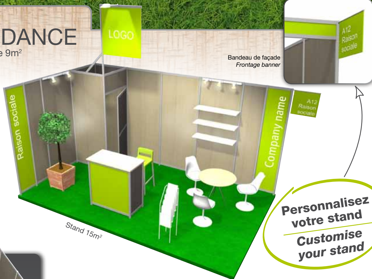
Bandeau de façade Frontage banner