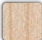
Mélangé sycamore Sycamore melamine