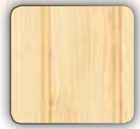
Sapin brut Untreated pine