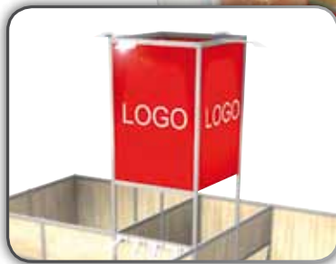
Tour signalétique 4 faces 4 sided tower