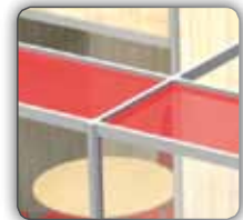
Bandeau de façade Frontage banner